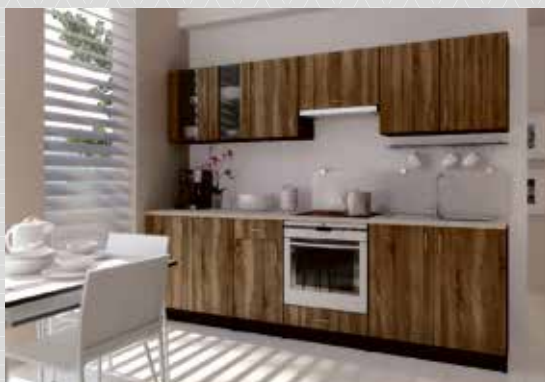
JULIA 240 cm (Julia, sonoma) tavahind 294 €