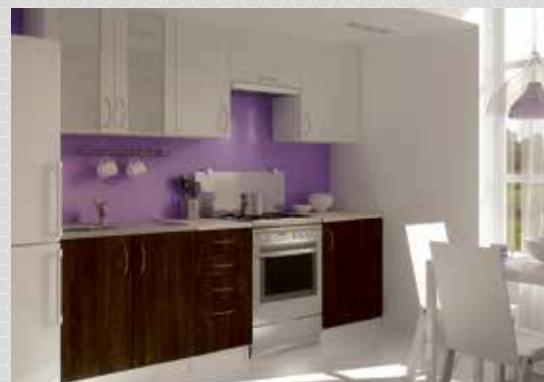
KENIA 240 cm (valge/wenge, wenge/wenge) tavahind 326 €