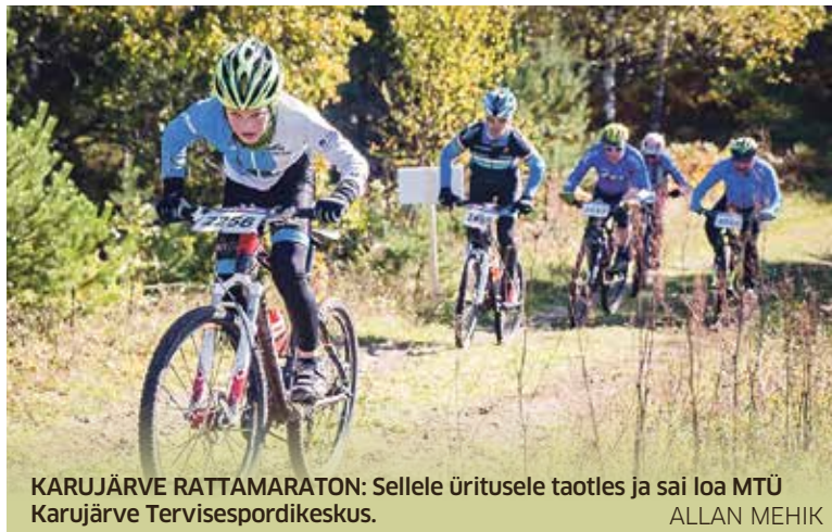
KARUJÄRVE RATTAMARATON: Sellele üritusele taotles ja sai loa MTÜ Karujärve Tervisespordikeskus. ALLAN MEHIK

Ürituse korraldaja võib olla füüsiline või juriidiline isik.