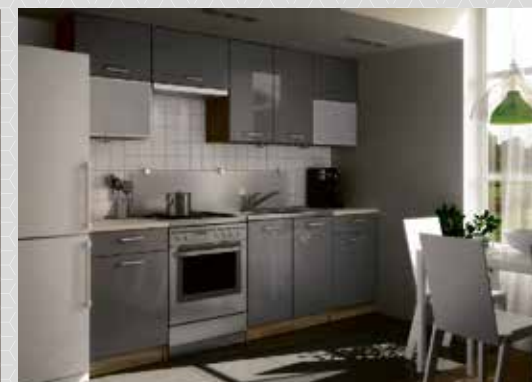
PERL 260 cm (valge, hall, roheline) tavahind 487 €