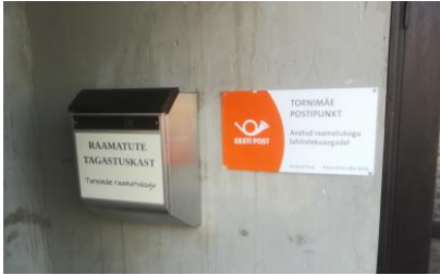
Pildil tagastuskast

Nüüd on võimalus raamatuid tagastada 24/7! Eelmisest nädalast on Tornimäe rahvamaja peaukse kõrval raamatute tagastuskast.