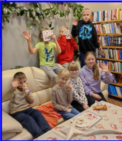
Fotodel: 3. jaanuaril raamatukogus koolivaheaja meisterdamistöös osalejad.

Minult on küsitud raamatukogu tuleviku kohta ja selle pärast muret tundud. Eelneva jutu ja arvude kokkuvõtteks võin julgelt öelda, et asume oma näitajatega Saare maakonna 26 maa-raamatukogu seas kenasti keskel ja mõnes asjas oleme kohe päris tublid.