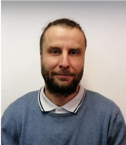
Fotol: teema autor Jüri Soo

10. jaanuaril toimus Tornimäe rahvamajas kogukonnakõnelused hariduse teemadel , kus Saaremaa vallaesindajad tutvustasid kava, mille järgi liidetakse lasteaed ja põhikool ning selle kolmas kooliaste kaotatakse aastaks 2025. Peamisteks argumentideks olid raha puudumine, vähene laste arv ja soov tõsta hariduse kvaliteedi üldiselt. Liitmise osas oldi üksmeel aga vastukaja kooliastme sulgemise kohta osutus ülimalt aktiivseks, kuna konkreetse kavaga ei olnud saadud eelnevalt tutvuda. See saadeti meilidele alles sama päeva lõuna paiku ning nüüd õhtul peaksid kohalikud selle justkui heaks kiitma.