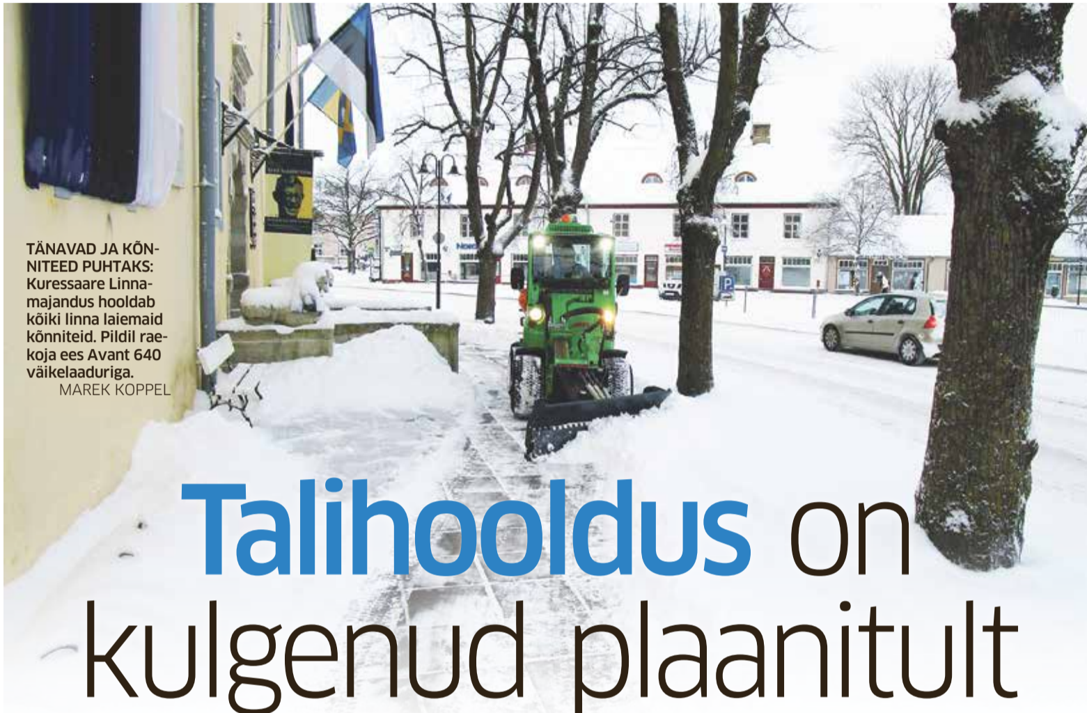
TÄNAVAD JA KÖNNITEED PUHTAKS: Kuressaare Linnamajandus hooldab kõiki linna laiemaid kõnniteid. Pildil rae-koja ees Avant 640 väikelaaduriga. MAREK KOPPEL