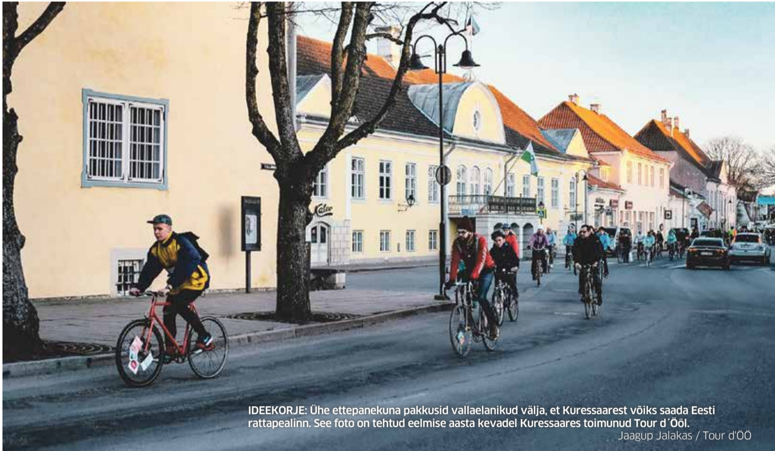
IDEEKORJE: Ühe ettepanekuna pakkusid vallaelanikud välja, et Kuressaarest võiks saada Eesti rattapealinn. See foto on tehtud eelmise aasta kevadel Kuressaares toimunud Tour d'Ööl.